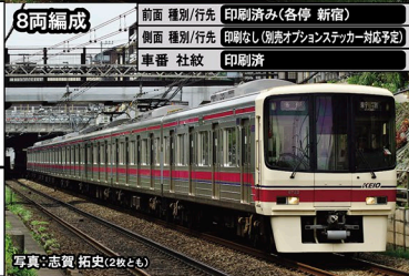
写真:志賀 拓史(2枚とも)