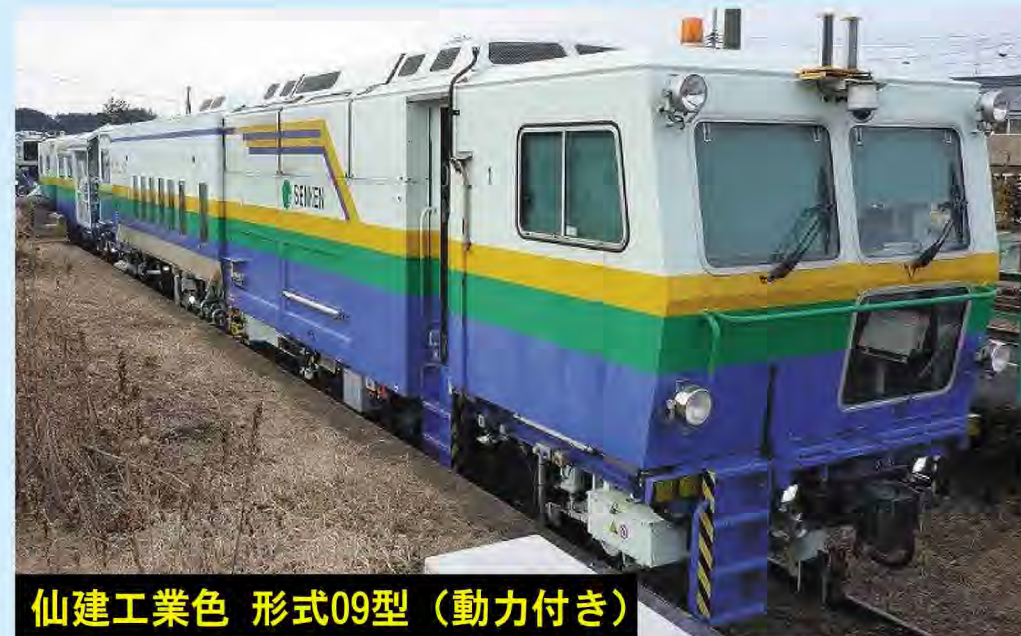
仙建工業色 形式09型 (動力付き)