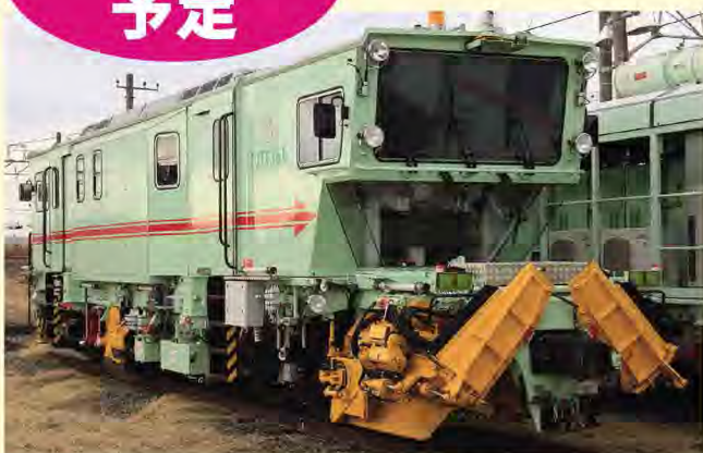
東鉄工業色 (動力付き)

保線車両メーカー・プラッサー&トイラー社の純正色と 東鉄工業株式会社色の2種類を模型化!