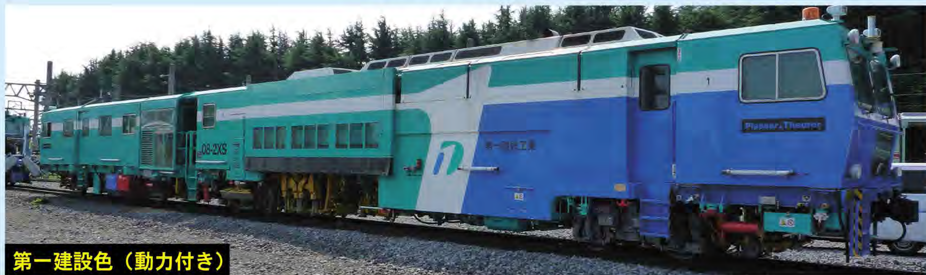
第一建設色 (動力付き)