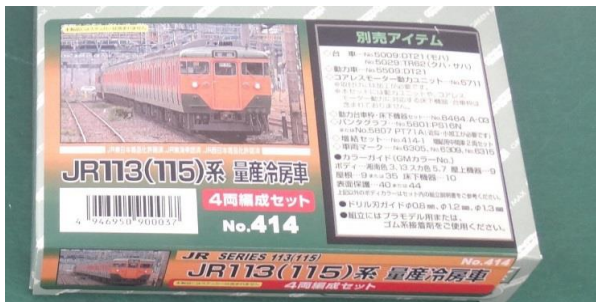
← 該当製品のラベル

対象ロット製品は、従来品とはパッケージのラベルが異なりますのでご確認のほどお願いいたします。 ※対応済み商品には、識別として商品名ラベルのJANコード脇に丸印(●)のシールを貼付します。