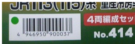
↑ 対応済を示す●シール

受付商品の正規対応版の返却につきましては、対応に要する日数等を現在調整しておりますので、決まり次第あらためて弊社公式サイト等でご案内申し上げます。