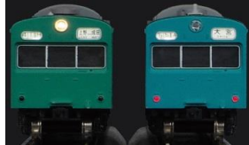
ヘッドライト・テールライトの点灯状態 点灯状態と非点灯状態の比較画像