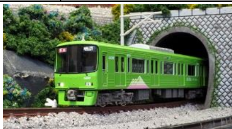
写真は試作品です。