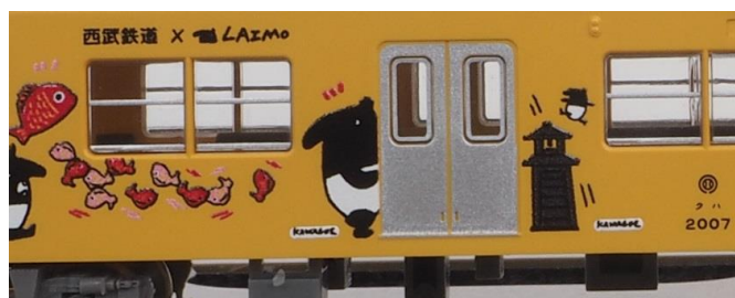
▲高精細印刷によるLAIMOラッピング