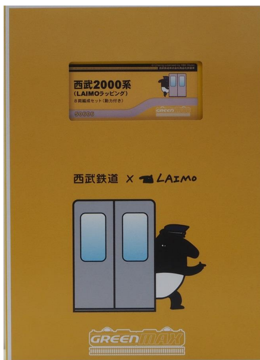
▲特製スリーブ仕様