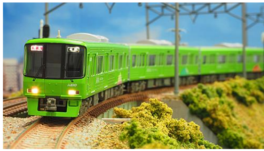
京王電鉄商品化許諾済

京王8000系は、京王の車両の中では初のVVVFインバータ制御を採用した車両で、1992年から1999年にかけて10両編成(6両+4両)14本・8両編成13本が製造されました。6000系の後継車として特急や準特急を中心に使用され、現在も京王を代表する主力車両となっています。 2005年までにパンタグラフがシングルアーム化され2008年頃までには方向幕がフルカラーLED化され、さらに2014年からは10両編成の中間先頭車の運転台部分を改造して客室化する等の大規模改修が行われました。 高尾山トレインは、2015年9月から運行されている車両で、かつての2000系を模したグリーンをベースに高尾山の四季等自然をイメージしたラッピングが施されています。