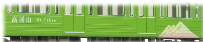
▲高尾山ラッピングを精密に印刷