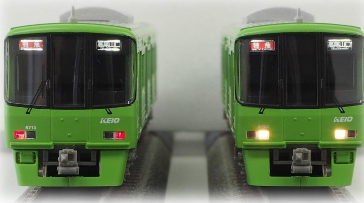
▲ヘッドライト・テールライト点灯