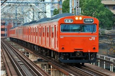
JR西日本商品化許諾済

103系電車は、1963年から1984年までに総勢3千数百両が製造された国鉄を代表する通勤形車両です。 JR西日本に引き継がれた103系は、車体延命や車内設備の改善等各種更新工事が行われ今日まで活躍しています。 長らく大阪環状線で活躍していた103系も、最後のLA4編成が平成29年10月3日をもって運行終了となりました。