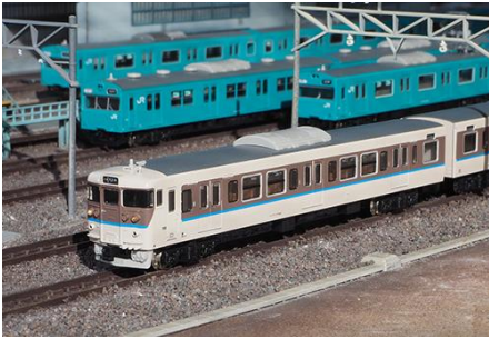
JR西日本商品化許諾済

JR西日本で活躍する113系のうち、状態の良い車両を対象に1998年から車体の大規模更新と座席の交換をはじめとする体質改善40N工事が施工されました。屋根の張り上げ化、ベンチレーターの撤去、側面窓ガラスの支持方式の変更や黒色サッシ化されている点が外観上の特徴です。薄茶色の塗装色をベースに、窓周りを茶色で塗り分け、同社のコーポレートカラーの青色のラインが入った更新色でカラーリングも一新されました。2009年からは地域に合わせた単色塗装に塗装変更されることとなり、順次更新色から地域色に塗装変更されています。製品は2004年頃に活躍していた京都総合運転所の灰色スカート装備のT1編成(No.50580)と黒色スカート装備のT2編成(No.50581)を製品化します。