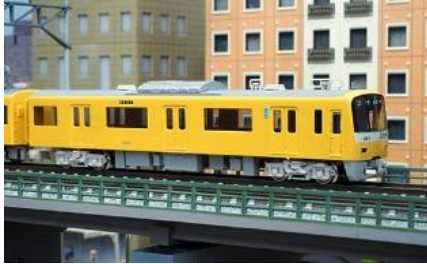
写真は試作品です。