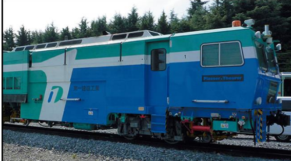
Plasser&Theurer社商品化許諾済 第一建設工業株式会社商品化許諾済

マルチプルタイタンパー(通称マルタイ)は、世界中で導入されている大型保線車両です。線路上を列車が走行する事により生じる線路の歪みをミリ単位で計測修正を行い、「レールクランプ」でレールを持ち上げ、道床(バラスト)を鉄の爪で突き固めて線路の性能を回復させます。日本国内仕様ではタンピング作業部に「騒音防止板」を装備しています。 新潟地区を主な活躍の場としている第一建設工業が所有するプラッサー&タイラー社製09-16をプロトタイプとしています。