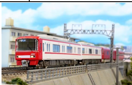
写真は試作品です。