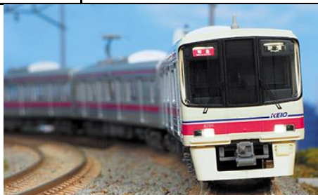
写真は試作品です。 京王電鉄商品化許諾申請中

京王8000系は、京王の車両の中では初のVVVFインバータ制御を採用した車両で、1992年から1999年にかけて10両編成(6両+4両)14本・8両編成13本が製造されました。6000系の後継車として特急や準特急を中心に使用され、現在でも京王を代表する主力車両となっています。 2005年までにパンタグラフがシングルアーム化され2008年頃までには方向幕がフルカラーLED化され、さらに2014年からは10両編成の中間先頭車の運転台部分を改造して客室化する等の大規模改修が行われました。また、近年ヘッドライトがLED化されています。