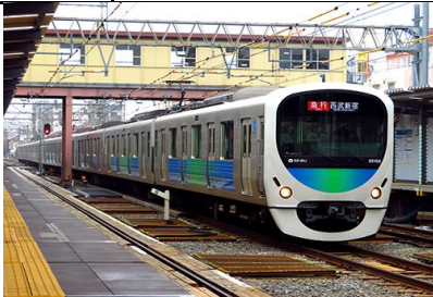
写真は今回製品化する編成とは異なります。 西武鉄道株式会社商品化許諾申請中

30000系は2008年4月に登場した新しい西武鉄道を象徴する通勤型車両で、「Smile Train～人にやさしく、みんなの笑顔をつくりだす車両～」をコンセプトに開発されました。西武鉄道の通勤車としては初の拡幅断面形状のアルミダブルスキン車体を採用し、車内案内装置にも15インチ液晶ディスプレイ(LCD)を搭載するなど快適性を高めています。内外装のデザインは「卵」をモチーフとして、外観は柔らかなふくらみと内装は温かみのある優しい空間をイメージしています。 基本となる8両編成に増結用の2両編成、及び貫通10両編成があります。