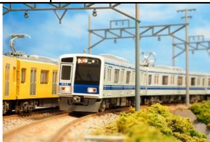
写真は試作品です。 西武鉄道株式会社商品化許諾申請中

西武6000系は1992年に登場した西武池袋線と東京メトロ有楽町線との相互直通運転用車両で、西武鉄道唯一のステンレス製車体を採用し、初めての10両固定編成車両として登場しました。くの字に曲がった先頭形状に地下鉄対応の非常用貫通路の設置など、それまでの西武電車にはないスタイルが特徴です。1996年以降製造された6151編成からは車体構造がアルミ製となり、更に1997年以降の6156編成～6158編成は戸袋窓が廃止されるなどの違いがあります。