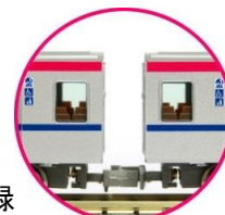
車端部ロングシートを表現