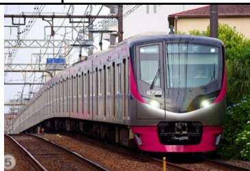
京王電鉄商品化許諾申請中

京王5000系は、京王電鉄16年ぶりの新型車両で、初の座席指定列車として開発された車両です。座席指定列車として使用される際はクロスシートに、それ以外の使用に際してはロングシートに変換できるようになっています。 外観デザインは、シャープで立体的な形状とスピード感のある配色が特徴で、最新の省エネ設計や安全性の一層の向上が図られています。車内も自然の風合を生かした落ち着いた雰囲気と上質さが演出されています。 これまでの新宿発橋本・京王八王子行き「京王ライナー」に加え、本年2月から朝の上り新宿行き「京王ライナー」が登場しました。