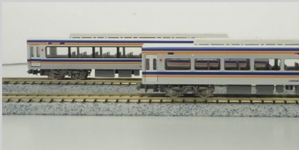
写真奥: 中間新造車 写真手前: 中間改造車