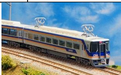
写真は試作品です。