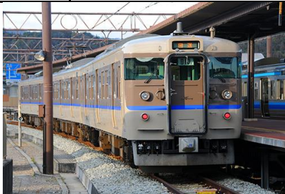
写真:猪俣 知十 JR西日本商品化許諾済

JR115系は、国鉄時代の1963年から1983年までにおよそ1900両が製造された勾配路線用の近郊形車両です。 1000番台は特に耐寒・耐雪強化構造を備え、クロスシートの間隔を拡大した「シートピッチ改善車」で、そのため側面の窓割が従来車と異なる他、電動車(クモハ・モハ)の車端部に雪切室冷却風取入ルーバーが設置されている等の特徴があります。 国鉄の分割民営化に伴いJR西日本に継承されたグループは、その後車体更新工事が行なわれ、「30N体質改善車」、「40N体質改善車」として現在も活躍しています。