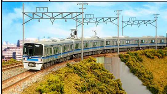
北総鉄道商品化許諾申請中

北総鉄道7300形は、1991(平成3)年3月の北総線京成高砂―新鎌ヶ谷間開業に伴い増備された18m3扉のステンレス車体にVVVFインバータ制御方式を採用した通勤型車両で、2編成が製造されました。京成電鉄3700形と共通の設計・仕様・性能を有する車両で、車体帯の色が北総カラーの青となっています。2007(平成19)年にはHOK'SOのロゴと先頭車側面の帯に航空機の翼をイメージしたアクセントが追加され、2015(平成27)年からパンタグラフがシングルアームタイプに換装され、窓ガラスにはグリーン系のUVカットガラスが採用されています。 7800形は、京成電鉄からのリース車両7050形・7250形を代替するため、同じく京成電鉄から3700形をリースにより導入したもので、2003(平成15)年に7808編成、2015(平成27)年に7818編成が登場しました。さらに2018(平成30)年には7828編成が同様に京成電鉄から3700形のリース車両として増備されています。