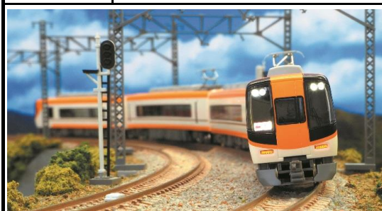
近畿日本鉄道(株)商品化許諾済

近鉄22000系ACEは、新世代の特急車両として1992年に登場した車両で、21000系や26000系の高貴な内装デザインを踏襲しつつ、座席構造の一新、バリアフリー対応設備の導入、乗降扉にプラグドアを採用、ボルスタレス台車やVVVFインバーター制御の導入等、内外装のデザインから車両性能等全てにおいて従来の近鉄特急車両は一線を画す設計思想の下で製造された車両です。2015年11月からリニューアル工事が実施され、喫煙室の設置と新しい近鉄汎用特急色に変更されています。