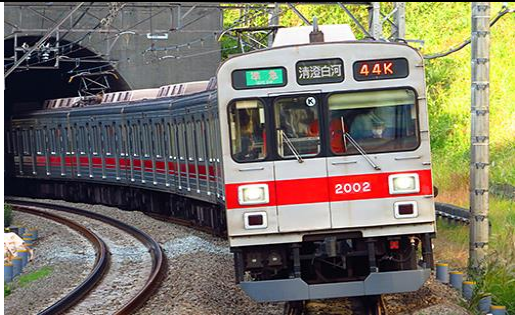
東京急行電鉄株式会社商品化許諾済

東急2000系は、1992年に田園都市線の輸送量増強のために新造された車両です。1986年に登場した9000系をベースに設計・製造され、東京メトロ半蔵門線乗入対応の装備を持ち、室内の改良、乗り心地の向上が図られました。93年に8両編成1編成が東横線に暫定投入されましたが、同年中に中間車2両を組み込み10両編成化のうえ田園都市線に転属しました。近年、スカートを取り付け、方向幕・前照灯のLED化が進められました。製品は、スカート取付け後で方向幕がLED化される前の時代を再現します。