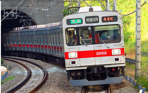
東京急行電鉄株式会社商品化許諾済

東急2000系は、1992年に田園都市線の輸送量増強のために新造された車両です。1986年に登場した9000系をベースに設計・製造され、東京メトロ半蔵門線乗入対応の装備を持ち、室内の改良、乗り心地の向上が図られました。93年に8両編成1編成が東横線に暫定投入されましたが、同年中に中間車2両を組み込み10両編成化のうえ田園都市線に転属しました。製品は、近年、スカート取り付け、方向幕・前照灯のLED化、車端部に黄色テープが貼付された姿を再現します。