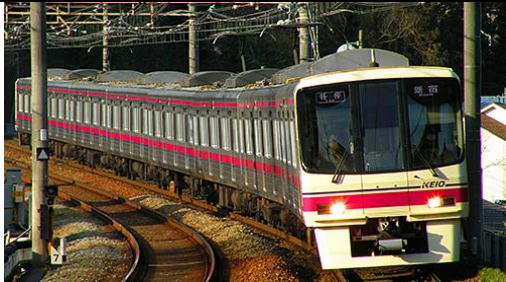
写真: 岩本 卓也 京王電鉄商品化許諾申請中

京王8000系は、京王の車両の中では初のVVVFインバータ制御を採用した車両で、1992年から1999年にかけて10両編成(6両+4両)14本・8両編成13本が製造されました。6000系の後継車として特急や準特急を中心に使用され、現在も京王を代表する主力車両となっています。 2005年までにパンタグラフがシングルアーム化され2008年頃までには方向幕がフルカラーLED化されています。 8032編成と8033編成は他の編成と異なるボルスタレス台車を装備しており、製品は客扉が大規模改修車と同様の窓がやや小ぶりなものに交換された8032編成をプロトタイプとしています。