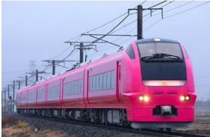
写真: 藤巻 佳一 JR東日本商品化許諾済

E653系1000番代は2012年に、それまで常磐線で「フレッシュひたち」として使用されていたE653系を、耐寒耐雪仕様に改造のうえ新潟地区に転用し、白新線・羽越本線の特急「いなほ」号として運用している車両です。 この度定期検査を終え出場したU107編成が、新たにハマナス色に塗色変更されました。ハマナスは沿線の海岸に自生する植物で、その花色が日本海に沈む夕日の海面の写りこむ色彩にも通じ、沿線風景を象徴する色を纏って登場しました。