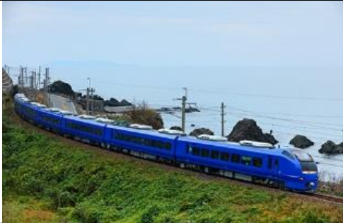
JR東日本商品化許諾済

E653系1000番代は2012年に、それまで常磐線で「フレッシュひたち」として使用されていたE653系を、耐寒耐雪仕様に改造のうえ新潟地区に転用し、白新線・羽越本線の特急「いなほ」号として運用している車両です。 この度定期検査を終え出場したU106編成が、新たに瑠璃色に塗色変更されました。沿線の大きな魅力である、日本海の透明感と幻想的な深い青さと、山並みの緑を取り込んで表現する色を纏って登場しました。