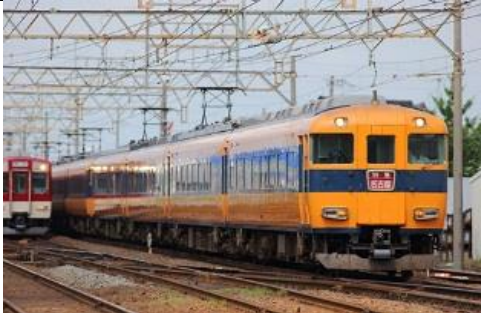
近畿日本鉄道(株)商品化許諾済

近鉄12600系は、12410系の改良型として1982年に4両編成で製造された車両で、12000系から続く近鉄特急デザインの最後の車両となりました。1986年には12602編成が増備されましたが、パンタグラフがMc車、M車とも各1基となり、トイレ・洗面所窓が省略されています。12601編成も更新に際してパンタグラフを各2基から1基に削減し、トイレ・洗面所窓が埋められました。2編成と少数派のグループですが、上記の登場経緯の違いにより、それぞれで屋上の構成がことなるのが特徴です。