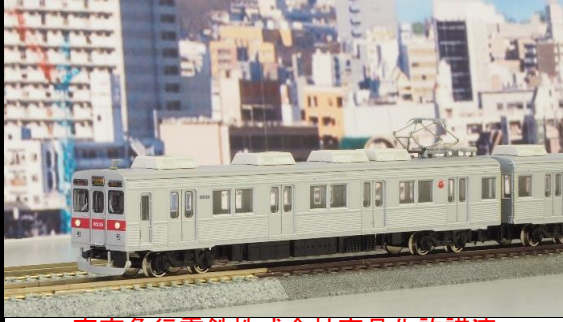
東京急行電鉄株式会社商品化許諾済

東急8500系は、地下鉄半蔵門線相互乗り入れに対応するため、8000系をベースに1975年から登場した車両です。2003年からは、田園都市線～半蔵門線～東武伊勢崎線(現東武スカイツリーライン)直通運転に伴い、東武線内でも活躍しています。 近年スカートが取り付けられ、車端部に黄色テープが貼付されています。