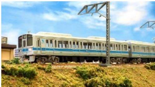
写真は前回製品です。