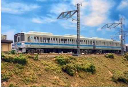
小田急電鉄商品化許諾済

小田急1000形は1988年に初のステンレス車体やVVVF制御を採用し登場した車両で、小田原線をはじめ江ノ島線・多摩線へと幅広く運用されており、かつては地下鉄乗入れの直通運転にも充当されていました。4両～10両編成のバラエティに富んだ編成があり、近年ではリニューアル車両も登場しています。製品は6両の1251編成と4両の1069編成を、ブランドマークが付いた現在の姿で再現します。両編成を組み合わせることで実物同様に4+6の10両編成が組成できます。