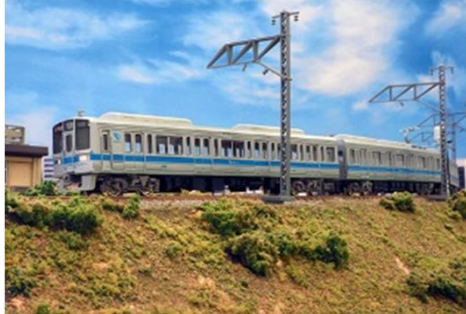
小田急電鉄商品化許諾申請中

小田急1000形は1988年に初のステンレス車体やVVVF制御を採用し登場した車両で、小田原線をはじめ江ノ島線・多摩線へと幅広く運用されており、かつては地下鉄乗入れの直通運転にも充当されていました。4両～10両編成のバラエティに富んだ編成があり、近年ではリニューアル車両も登場しています。製品は6両の1251編成と4両の1069編成を、ブランドマークが付いた現在の姿で再現します。両編成を組み合わせることで実物同様に4+6の10両編成が組成できます。