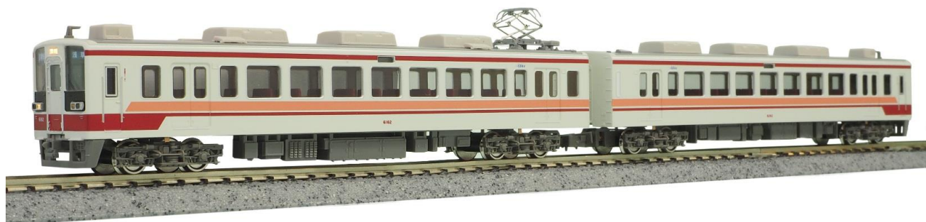
▼東武グループロゴも精密に再現