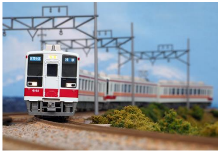
東武鉄道商品化許諾済

東武6050系は6000系の車体更新によって登場した2扉セミクロスシート車両で、1985年から1986年にかけて2両編成22本が更新により登場しました。更新途中に車両が不足することから完全新造編成が1985年に1編成、1986年に1編成、1988年に増備(これらの2編成は野岩鉄道へ譲渡)され、その後は7編成および野岩鉄道向けの1編成が増備、1990年には会津鉄道向けに1編成が製造されています。完全新造編成は台車がSUMINデン型台車になっている点の特徴です。1996年には増解結の効率化を図るため、先頭部の連結器が、自動連結器から電気連結器付き密着連結器へ交換され、前面向かって左側に取り付けられていたジャンパ栓受けが撤去されています。2001年3月のダイヤ改正から日光線の普通列車で運用される事となり、5編成に霜取り用パンタグラフが増設されました。また、2006年の区間快速の登場に合わせて完全新造車2編成に追加で霜取りパンタグラフが増設されています。