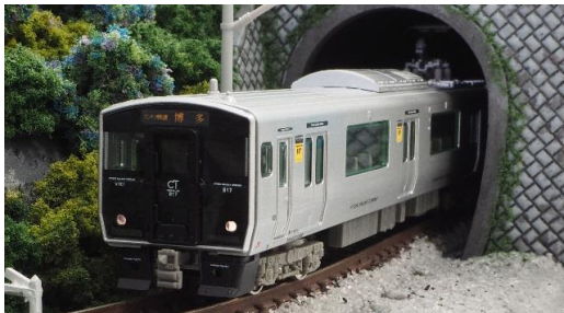
写真は試作品です。 JR九州承認済

JR九州817系は、2001年に北九州地区に導入された20m3扉の近郊型車両で、その後使用線区にあわせたバリエーション展開により九州全域で活躍しています。0番台・1000番台・1100番台はアルミヘアライン仕様の転換クロスシート車、2000番台・3000番台はアルミ車体に白色塗装を施したロングシート車です。2～3両で1ユニットとして編成され、他形式(813・815系等)との併結や数ユニットの併結による長編成での運用も可能な車両で、各地域都市圏の混雑緩和に貢献しています。今回製品化をする1100番台は、篠栗線(福北ゆたか線)の混雑緩和を目的として、2007年に登場致しました。1000番台に比べて、前面・側面の行先表示機が拡大され、クモハの妻面の貫通扉が設置されているのが大きな特徴です。2017年7月現在で4編成が篠栗線(福北ゆたか線)を中心に活躍しています。