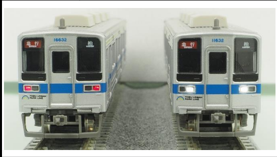
東武鉄道商品化許諾済

東武10030型は、10000系のマイナーチェンジ車として1988年4月以降製造されたグループで、正面形状やコルゲート車体からビードプレス車体への変更等外観が大きく変化しています。2011年3月にはリニューアル工事が開始され、スカート取付け、ヘッドライトのHID化、種別・行先表示機のフルカラーLED化、車外スピーカー設置等外観上の変化が見られます。6両固定編成の一部は東武アーバンパークラインに転属となり、帯色が同線専用の色に変更され、「TOBU URBAN PARK LINE」が貼付された他、貫通幌の取付金具や前面渡り板が撤去され、現在はホーム検知装置が設置されています。