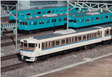
JR西日本商品化許諾済

JR西日本で活躍する113系のうち、状態の良い車両を対象に1998年から車体の大規模更新と座席の交換をはじめとする体質改善40N工事が施工されました。屋根の張り上げ化、ベンチレーターの撤去、側面窓ガラスの支持方式の変更や黒色サッシ化されている点が外観上の特徴です。薄茶色の塗装色をベースに、窓周りを茶色で塗り分け、同社のコーポレートカラーの青色のラインが入った更新色でカラーリングも一新されました。2009年からは地域に合わせた単色塗装に塗装変更されることとなり、順次更新色から地域色に塗装変更されています。製品は2011年頃の阪和線で活躍していたHG404編成(No.30645基本セット)とHG406編成(No.30646増結セット)を製品化します。