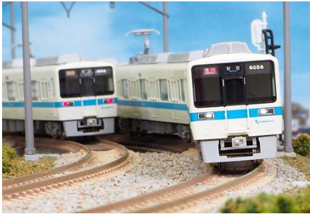
小田急電鉄商品化許諾済

小田急8000形は、1982年(昭和57年)から1987年(昭和62年)にかけて製造された地上専用車であり、各停から快速急行まで使用される汎用車です。4両編成と6両編成が各16本(4両編成64両・6両編成96両)、合計で160両が製造されました。登場時より大きな変化もなく使用されてきましたが、2002年度より6両編成、2007年度より4両編成の更新工事を行い現在は全編成施行済みとなっています。前面と側面の行先表示器のLED化と、前面通過表示灯撤去、側面行先表示器の形状変更、車側灯・尾灯のLED化がされています。