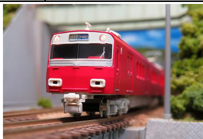
写真は前回製品です。