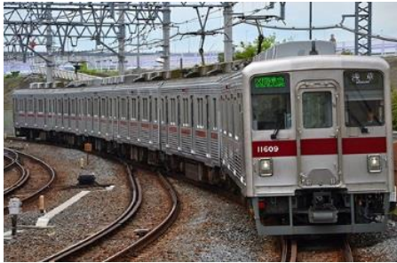
東武鉄道商品化許諾申請中

東武10000型は、8000系の後継車として1983年から製造された車両で、9000系をベースとしたステンレス製20mの車体で、2両編成・6両編成・8両編成が製造され伊勢崎線と東上線にそれぞれ配備されました。2007年からはリニューアル工事が施工され、一部パンタグラフ撤去、前照灯の更新、種別行先表示器のフルカラーLED化、車内更新などが行われ2015年に東武スカイツリーラインの車両は全車リニューアル化が完了しました。2010年から施工が開始された編成は車内外ともに一部施工内容が変更されています。