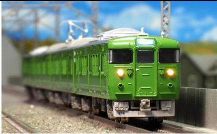
写真は試作品です。