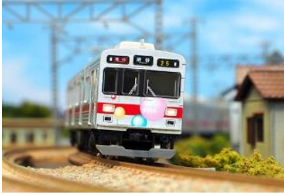
写真は試作品です。 東急電鉄株式会社商品化許諾申請中

東急電鉄9000系は、1986年から導入された東急電鉄初のVVVF制御を採用した車両で、東横線に8両編成が14本、大井町線に5両編成が1本投入されました。車体は、東急電鉄の標準的な切妻20m車ながら、将来の地下鉄乗入を想定して前面に非常用貫通路がオフセットして設置されているのが特徴です。「TOQ-BOX」と呼ばれた編成のうち9013編成は車体にシャボン玉の装飾がラッピングがされ東横線で運転されていました。