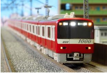
写真は試作品です。