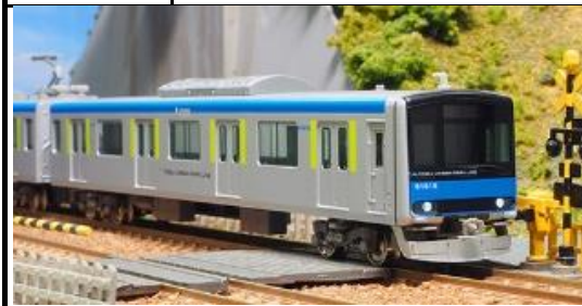
写真は東武アーバンパークラインの試作品です。 東武鉄道商品化許諾申請中

東武60000系は、2013年から東武野田線に導入された、野田線用車両では初の新車導入となった車両です。本線系統の50000型をベースに、更なる環境への配慮や省メンテナンス、省エネルギー化、バリアフリーの推進、安全性・快適性の向上を図っています。車体は50000型に続き20m4扉のアルミ製で、東武グループカラーのフューチャーブルーに野田線沿線の自然環境と調和するものとしてブライトグリーンを配したカラーデザインとなっています。 2014年4月から野田線に「東武アーバンパークライン」の愛称が付き、各編成に「TOBU URBAN PARK LINE」のロゴが表示されています。