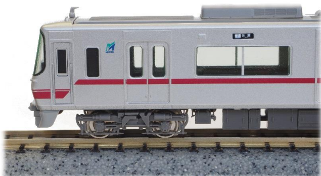
▲ボルスタ付き台車編成