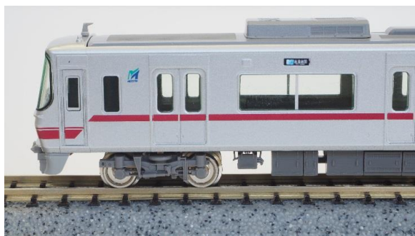
▲ボルスタレス台車編成