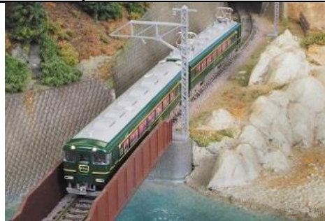
近畿日本鉄道(株)商品化許諾済

15400系「かぎろひ」は、12200系スナックカーから改造され2011年に登場した団体専用列車です。 車体色はクラブツーリズムバスツアーの最上級ブランド「ロイヤルクルーザー四季の華」に運用されているバスのデザインを踏襲した、落ち着いた上質感にあふれるグリーンにゴールドのラインが入っています。 2両編成単位から4両編成でも運用されており、他形式との併結運用も見られます。