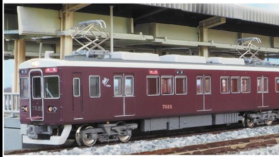
阪急電鉄商品化許諾申請中

7000/7300系は、阪急において最大勢力を誇るグループで、6000系、8000/8300系、かつては9000/9300系との混結も行ない、特急から普通までオールマイティに活躍中の車両です。7000系は神戸・宝塚線用に1980(昭和55)年から1988(昭和63)年まで製造され、神戸線に172両(8連15本、6連5本、2連7本、その他10両)、宝塚線に38両(8連3本、4連1本、2連5本)が在籍しています。7300系は京都線用に1982(昭和57)年から1989(平成元)年まで製造され、83両(8連6本、2+6連3本、2連5本、休車1両)が活躍中です。近年はリニューアル更新車も登場しています。 ※2016年現在