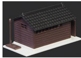
※写真は試作品です。

レイアウトを作成するには必須なストラクチャー。リアルな町並みを再現できます。この着色済みトイレ(物置)はトイレまたは物置を1棟製作することができます。台紙に切り抜きパーツ(トイレ各種表示、消火器箱や立入禁止表示など)が付属しますので、ハサミやカッターなどで切り抜いて目的に応じてご使用ください。