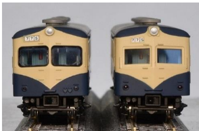
写真1.左)Hゴム支持の前面、右)木枠支持の前面