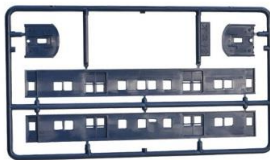
青色成型イメージ